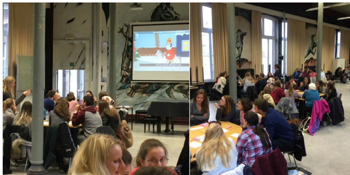
Lerarenopleiding HOGENT-Toekomstige leerkrachten reflecteren over “Zwarte Piet”